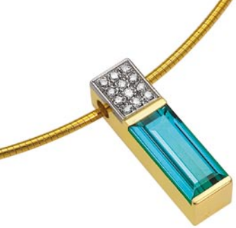
Collier Turmalin Collier GG+PWG Turmalin aus Namibia 3.55 ct Diamanten 0.18 ct handgefertigtes Einzelstück